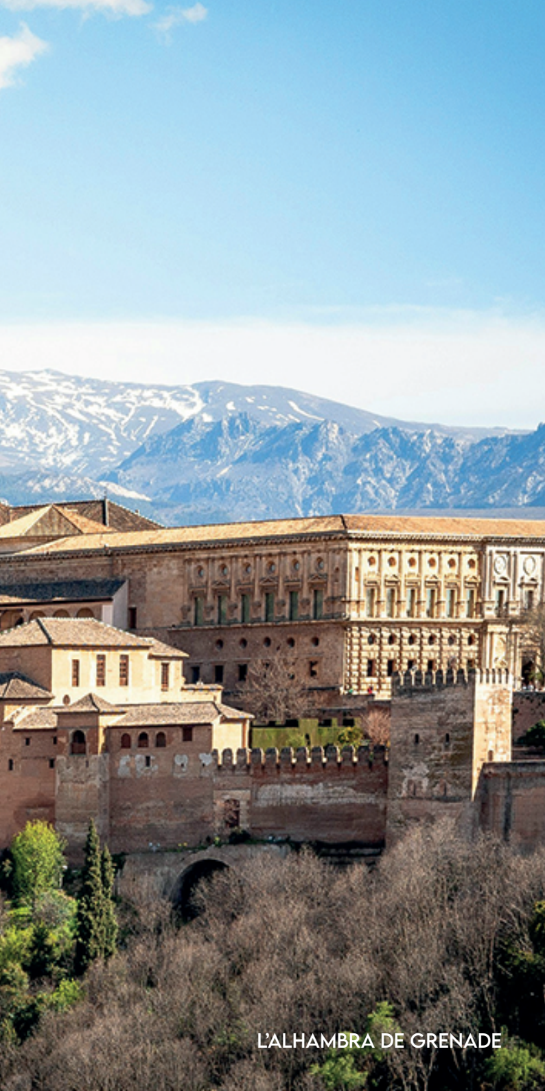
L'ALHAMBRA DE GRENADE